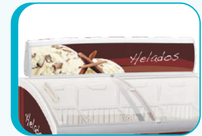
COPETE PROMOCIONAL OPCIONAL