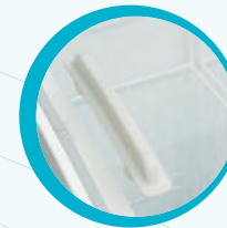
PUERTA CON JALADERA EN EL CRISTAL