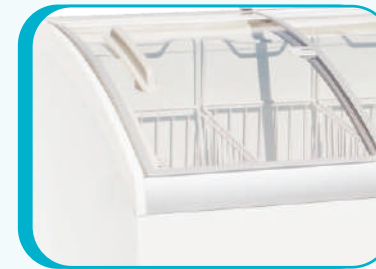
PUERTAS DE VIDRIO DESLIZABLES