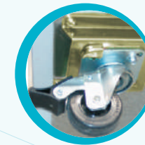
RUEDAS CON FRENO OPCIONAL